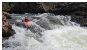
Nedre Stranda Voss