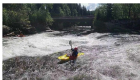
Nedre Stranda Voss